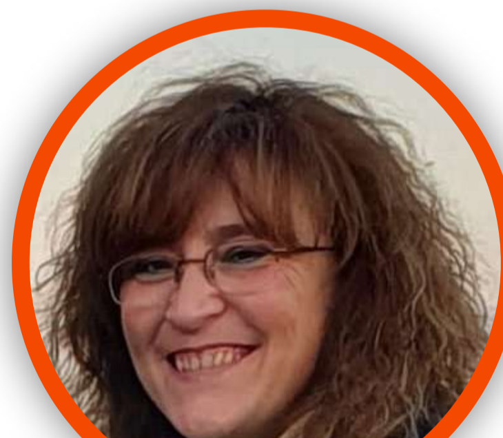
MARIANGELA MAPELLI SCUOLA PRIMARIA